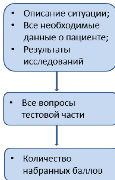
Рисунок 1. Линейный сценарий прохождения ИСЗ.

Линейный сценарий прохождения ИСЗ представлен на рисунке 1.