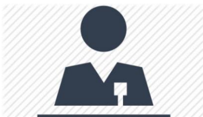
Рисунок 2. Пример расположения лектора в кадре.